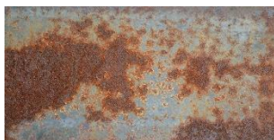
Beginn des Rosteffekts