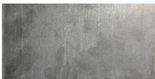
Aspekt bei der Lieferung